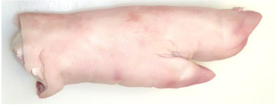
FOTO DE LA MATERIA PRIMA - RAW MATERIAL