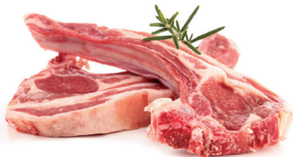
572 CHULETAS DE CORDERO NACIONAL 1 Caja x 3,6 kg