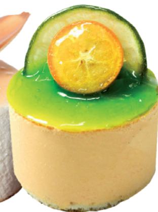
2306 DELICIOSO DE CÍTRICOS