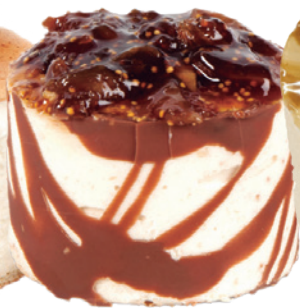
2117 DELICIOSO DE HIGO