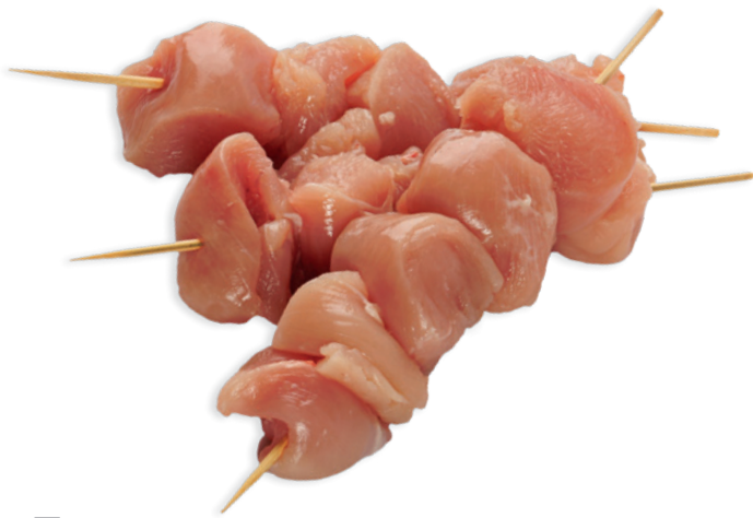
❄️ 1271 PINCHO DE SOLOMILLO DE POLLO 80 G 1 Caja x 25 uds.