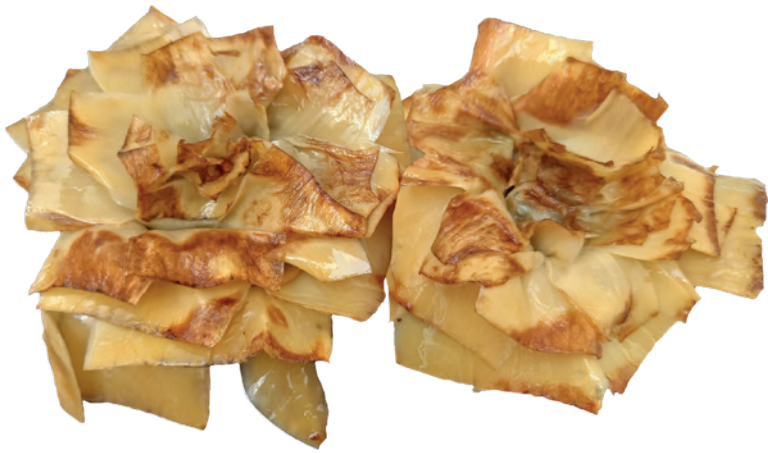
518 FLOR DE ALCACHOFA CONFITADA 4 Bandejas x 12 uds.