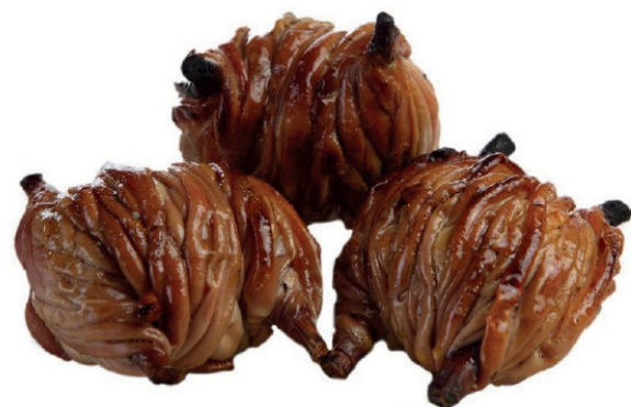
❄️ 685 ZARAJOS (170 G APROX.) 1 Caja x 15 uds.