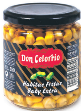
1442 HABITAS BABY FRITAS CON ACEITE DE OLIVA 12 Botes x 220 g