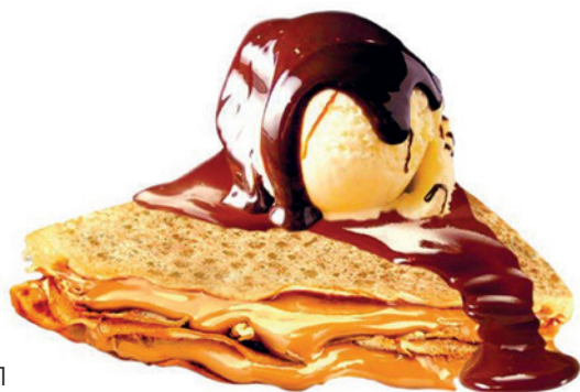
231 CREP DE TURRÓN 20 Unidades x 80 g