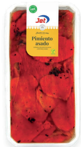
1396 PIMIENTO ROJO ASADO 2 Bandejas x 1,5 kg