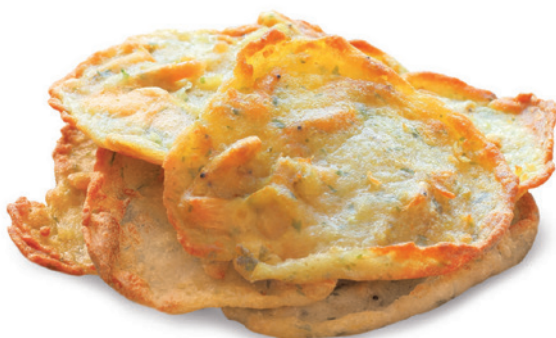
1635 TORTITAS DE CAMARÓN 1 Estuche x 36 uds.