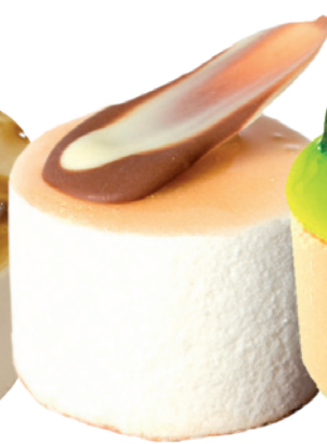
2307 DELICIOSO DE HORCHATA