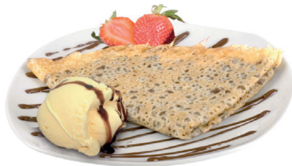
2501 CREP DE NUTELLA 24 Unidades x 70 g