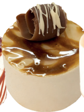
342 DELICIOSO DE CREMAET