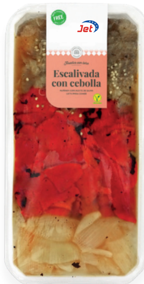
1074 ESCALIVADA CON CEBOLLA 2 Bandejas x 1,5 kg