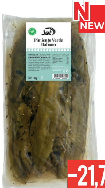
592 PIMIENTO VERDE ITALIANO ASADO 3 Bandejas x 1 kg