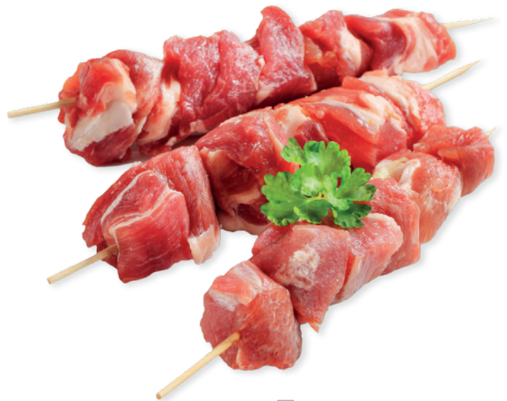
❄️ 1797 PINCHOS DE PAVO 50 G 1 Caja x 40 uds.