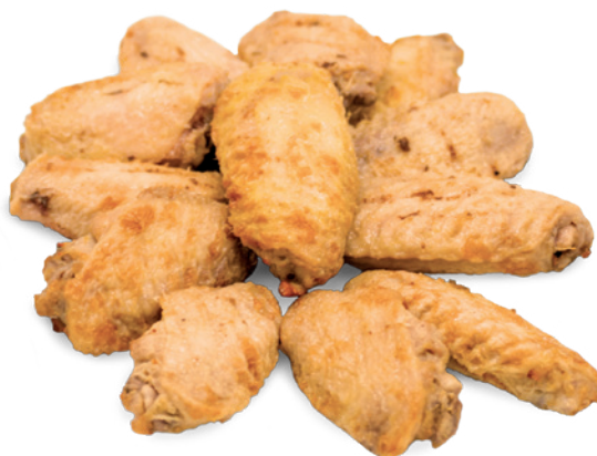
❄️ 547 ALAS DE POLLO MARINADAS 2 Bolsas x 2,5 kg