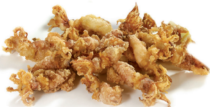
1387 PUNTILLA ENHARINADA 1 Caja x 2 Kg