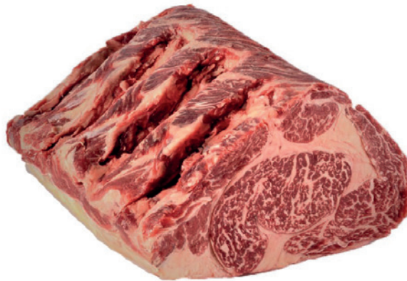
2349 ENTRECOT LOMO ALTO MADURADO DE VACA (4/6 KG/PIEZA) Pieza de 4,45 kg aprox.