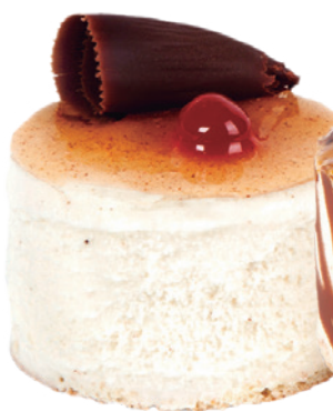
1931 DELICIOSO DE LECHE MERENGADA