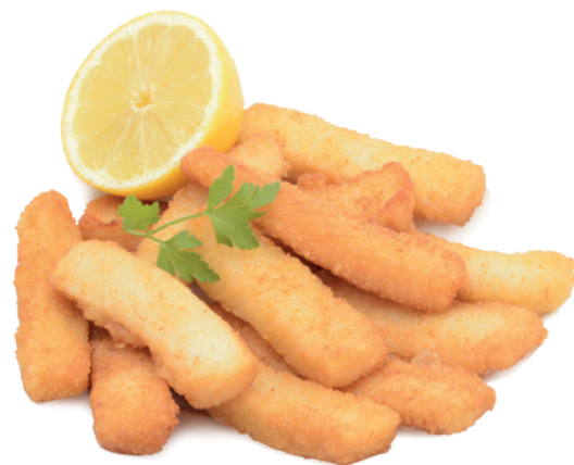
273 RABAS GRAN CHEF 2 Bolsas x 2 Kg