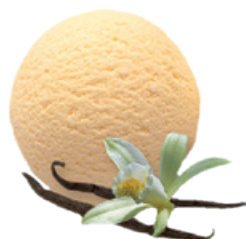
1647 ❄️ GRANEL DE VAINILLA