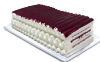
1366 ❄️ TARTA LAMINADA EMPERATRIZ