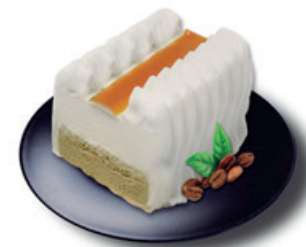
1812 ❄️ TARTA AL WHISKY MENÚ