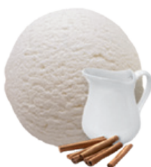
1747 ❄️ GRANEL DE LECHE MERENGADA