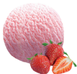
1645 ❄️ GRANEL DE FRESA