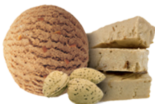
1675 ❄️ GRANEL DE TURRÓN