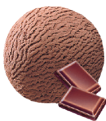
1644 ❄️ GRANEL DE CHOCOLATE