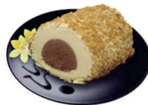
497 ❄️ BRAZO CROCANTI