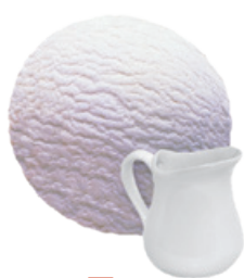
1646 ❄️ GRANEL DE NATA