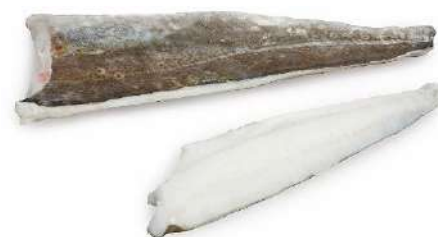
FILETE DE BACALAO MENU 1000 UP