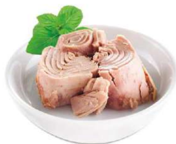
ATÚN BOLSA HERSAN