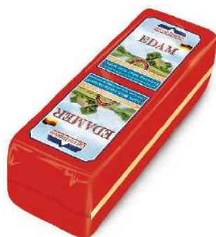
BARRA EDAM ALEMANA