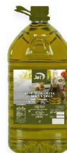
ACEITE OLIVA VIRGEN EXTRA 3X5L