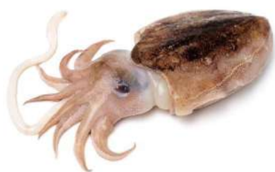
SEPIA SUCIA MAR DEL NORTE 50/300