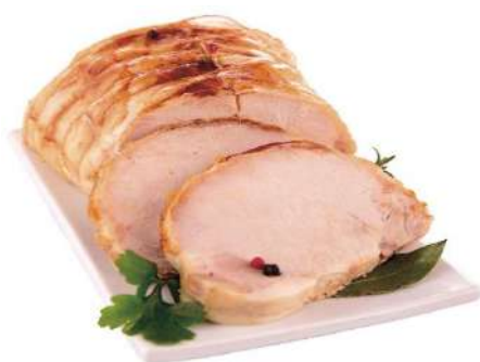
ROTI DE PAVO P.V.