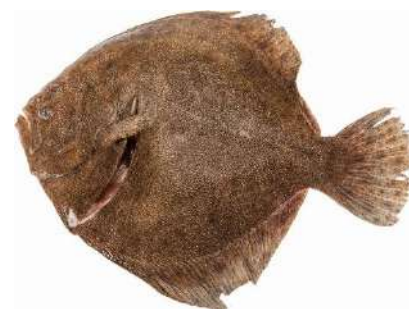
RODABALLO ENTERO 400/600