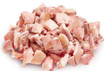
CARETA DE CERDO TROCEADA