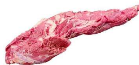
SOLOMILLO DE VACA 2/2,5