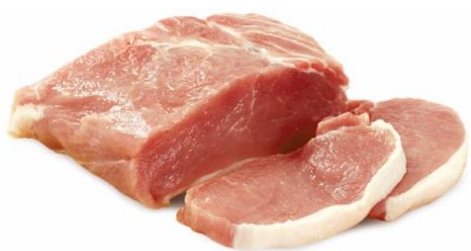
CINTA DE LOMO DE CERDO FRESCA