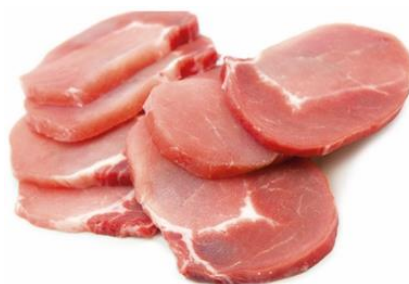
CINTA LOMO FILETEADA FRESCA