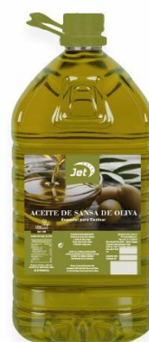
ACEITE DE ORUJO DE OLIVA (SANSA) JET