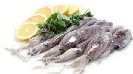
CALAMAR PATAGÓNICO N4 10/12 CM