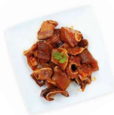
OREJA DE CERDO COCIDA ADOBADA