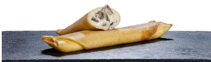
CREP DE BACÓN, CHAMPIÑÓN Y QUESO MANCHEGO