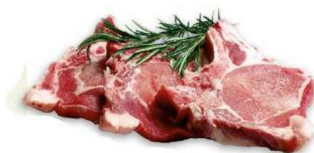
CHULETA CENTRO DE CERDO