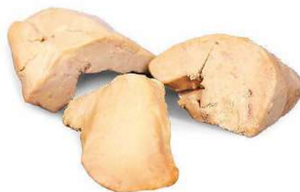
PUNTAS DE HIGADO DE PATO