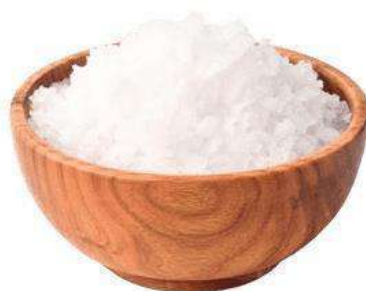
SAL MALDÓN PAQUETE