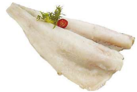
FILETE DE CARBONERO CON PIEL AL PUNTO DE SAL 1000UP