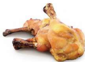
TULIPAS DE POLLO BBQ