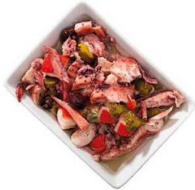
PICADILLO DE PULPO 35% (SALPICÓN)