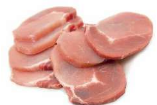
CINTA DE LOMO FILETEADA FINA 7 MM