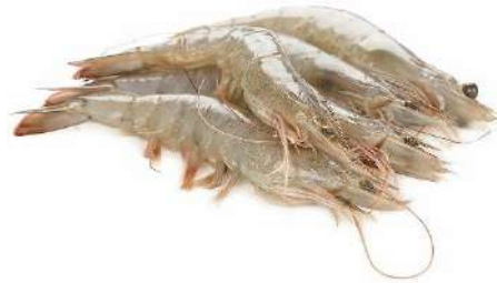
LANGOSTINO VANNAMEI 40/50