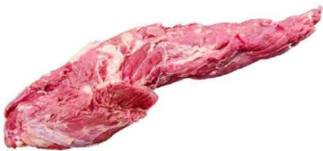
SOLOMILLO DE VACA 2 / 2,5