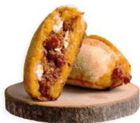
PREÑAITO DE LOMO QUESO DE CABRA CEBOLLA