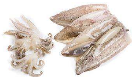
CALAMAR PATAGÓNICO LIMPIO CON PIEL 10/13