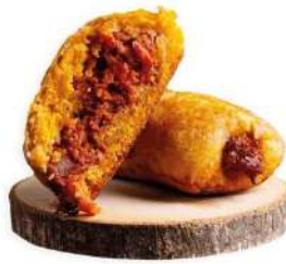
PREÑAITO DE CHORIZO IBÉRICO PICANTE