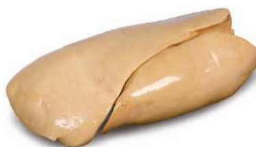
HIGADO DE PATO 500/800