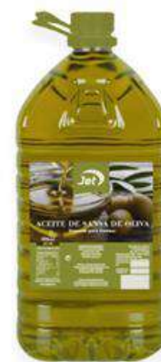
ACEITE DE ORUJO DE OLIVA (SANSA)